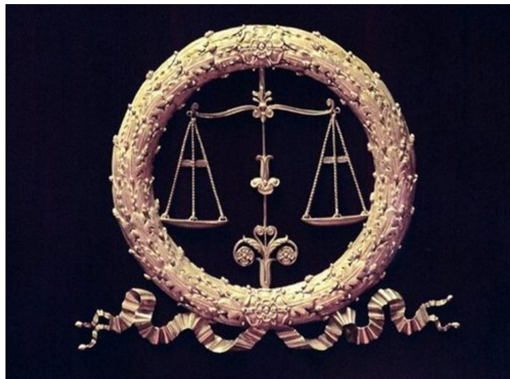
La balance de la justice

Recommander Soyez le premier de vos amis à recommander ça. Tweeter +1